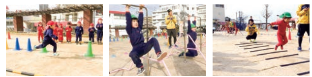
▲ 他地域でのこれまでの取り組みの様子 ▲

#ミライキッズプロジェクトについての情報や、 全国のようす、子育てに関するコラムなど 役立つ情報が満載!